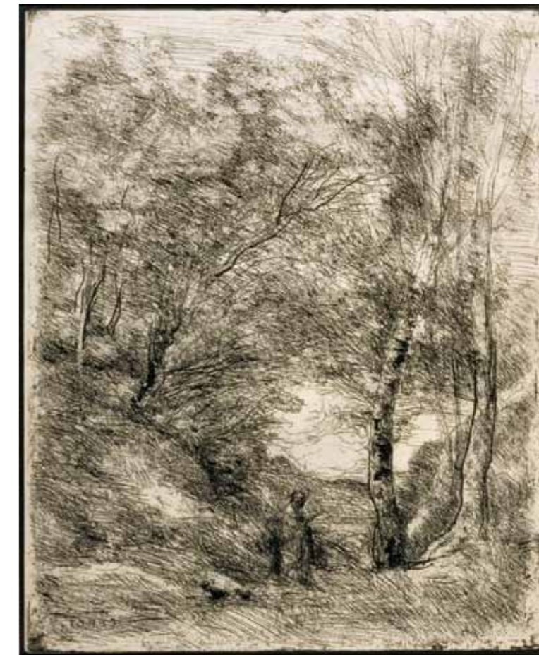
Corot, Le jardin d'Horace

Il collezionista classico ha spesso un rifiuto di fronte