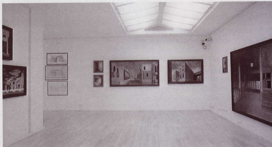
Nelle sale della galleria vengono esposte opere di artisti di rilievo internazionale.