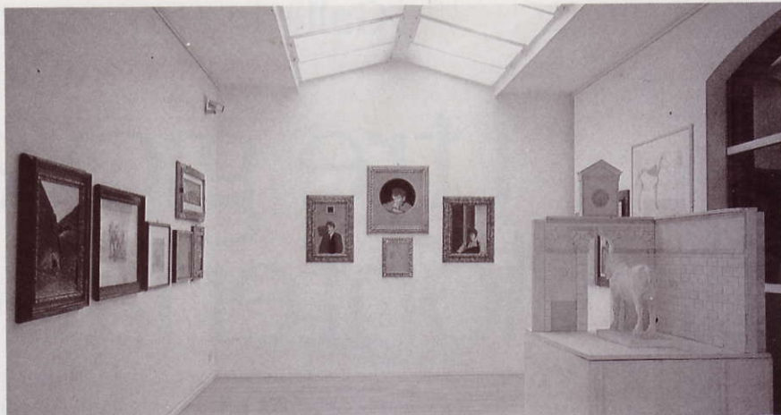
La galleria Daverio, ristrutturata di recente, si sviluppa nello scantinato di un palazzo.

Quarta intuizione, suggerita dalla conoscenza di Pareto: "A metà degli