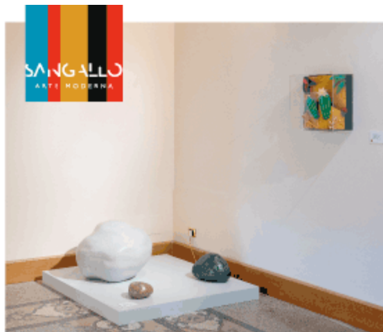
PIERO GILARDI Rigenerare la natura

Musei Civici di Palazzo D'Avalos Vasto 8.08 - 24.9.2023